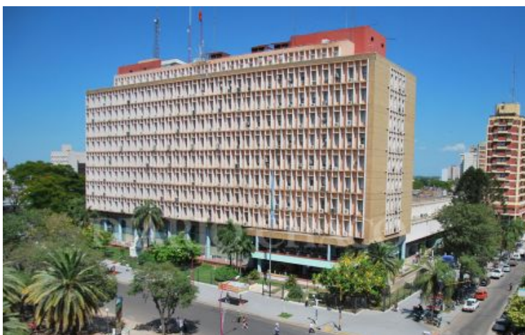
Frente Ala Ministerios. Casa de Gobierno de Chaco. Diario Norte. 9 de marzo de 2018

También fueron reutilizadas 700 ventanas y puertas de cedro de gran calidad provenientes de la sincrónica demolición del Hospital de Paso de los Libres y compradas a un precio irrisorio.