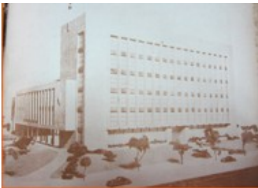
Vista de Casa de Gobierno. Proyecto Mauri. 1949. Oficina Cartográfica. Ministerio del Interior

En primer lugar se planea utilizar la partida asignada para demoler el edificio de Jefatura . Russo anticipa que la suma para la construcción “del monumental Palacio de Gobierno” se amplió de seis a diez y ocho millones “con vistas a la futura provincialización del Chaco” .