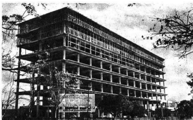
EDIFICIO EN CONSTRUCCIÓN para la Casa de Gobierno de la provincia

A partir de ahí efectivamente como expresa el secretario del gobernador a ingenieros del MOP “su gran esqueleto ofrece el lamentable espectáculo de una monumental obra abandonada” . Después del golpe militar de 1955 “las demás provincias se negaron a seguir contribuyendo porque su estado financiero no se los permitía” .